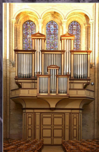
L'orgue de tribune (1988) Danion III / P 41

Orgue d'esthétique sonore brillante, inspirée par le mouvement néo-classique de la deuxième moitié du XXème siècle